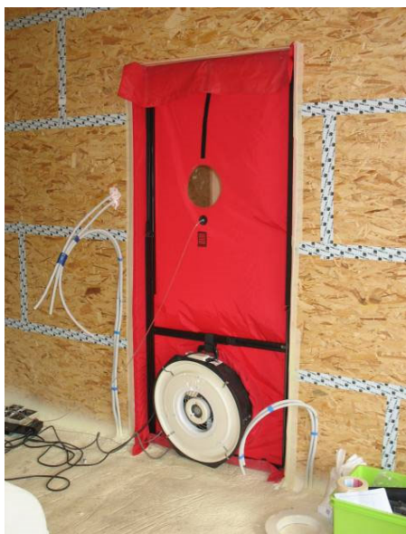
Voorbeeld van luchtverplaatsingapparatuur (Minneapolis Blower Door)

Om een idee te hebben van de grootteorde van het lek, berekent men de effectieve lekoppervlakte ELA_{10} (Oppervlakte van een opening die hetzelfde luchtdebiet bij hetzelfde drukverschil zou veroorzaken als alle lekken van het gebouw samen). De ELA_{10} waarde wordt berekend bij 10 Pa.