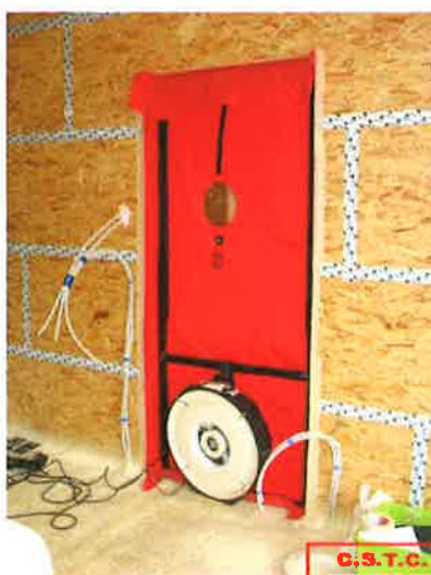
Voorbeeld van luchtverplaatsingapparatuur (Minneapolis Blower Door)

Om een idee te hebben van de grootteorde van het lek, berekent men de effectieve lekoppervlakte ELA_{10} (Oppervlakte van een opening die hetzelfde luchtdebiet bij hetzelfde drukverschil zou veroorzaken als alle lekken van het gebouw samen). De ELA_{10} waarde wordt berekend bij 10 Pa.